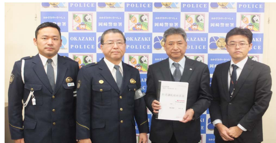
12月12日 岡崎警察署へ署名を提出